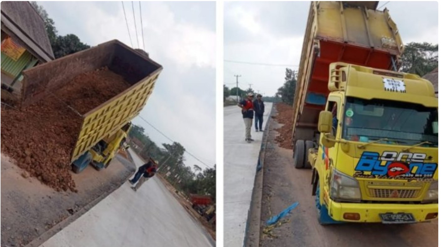
Mobil Pengangkut Tanah Galian C